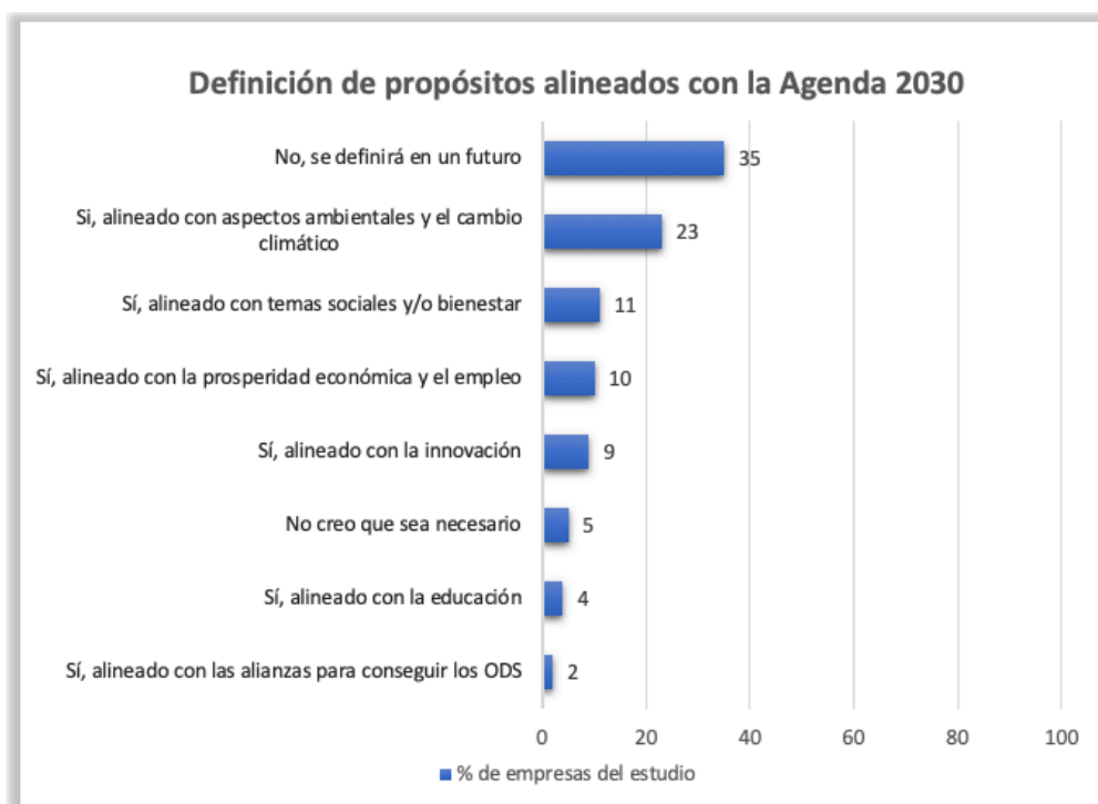
Gráfica 1. Definición de propósitos alineados con la Agenda 2030