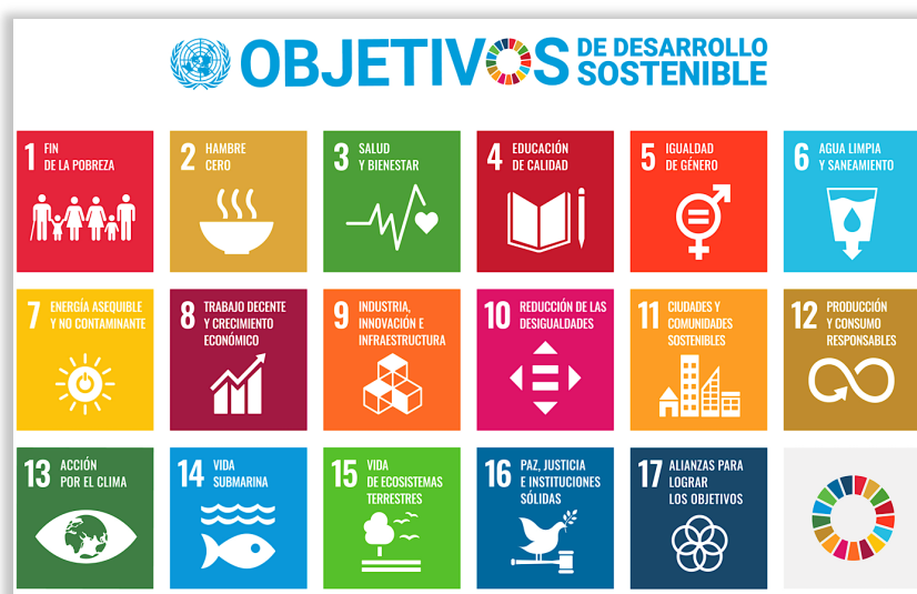
Imagen 1. Objetivos de Desarrollo sostenible

Como se pueden observar, los 17 ODS aparecen claramente diferenciados, pero ello no nos debe hacer suponer que no estén interrelacionados, ya que no actúan ni actuarán de manera independiente en ningún caso, es decir, son complementarios unos de otros. Esto es así, gracias a una característica común presente en todos ellos, la transversalidad, por lo que el hecho de centrarnos sólo en algunos ámbitos (ambiental), no abre la posibilidad de pasar por encima el resto de objetivos, por que, el desarrollo sostenible está directamente vinculado a la economía y al consumo, tanto de las empresas como de las instituciones como se podrá ver en líneas posteriores del presente trabajo. Hoy día, observamos en cada uno de los organismos oficiales de la gran mayoría de los Estados del mundo, un logotipo muy colorido y particular, nos hemos de referir al logo de los 17 ODS representados en una ruleta de colores, los cuales podemos observar a continuación: